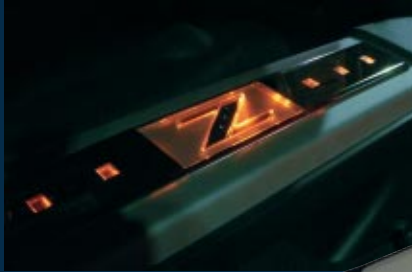
Beleuchtete Einstiegsleisten Illuminated entrance panels